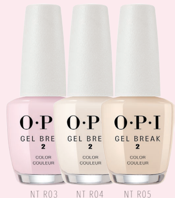
NT R03 NT R04 NT R05

自然な美爪効果をもたらすファンデーションカラー全3色。ケアをしながら爪を綺麗に見せます。スキントーンに合わせて色をお選びください。